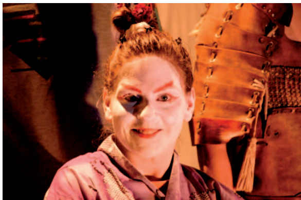
Predstavenie Haiku