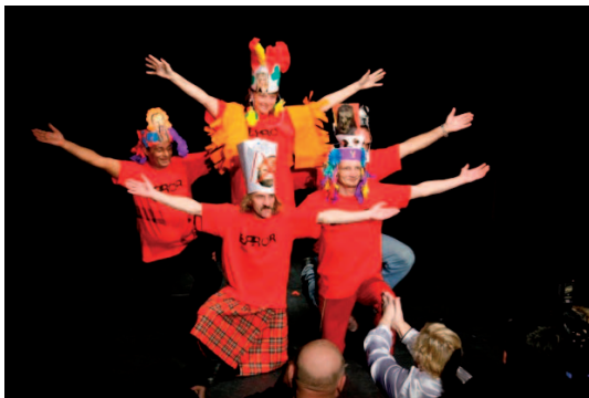
Predstavenie Kuca paca

Mala som predsudky, že čo ja tam medzi nimi budem, veď bezdomovci. Ľudia na okraji spoločnosti, väčšinou odsudzovaní druhými. Ale keďže som umelecká duša a divadlo ma vždy lákalo, povedala som si, že novou skúsenosťou nič nestratím. Moja intuícia bola správna. Nič som nestratila, naopak získala.