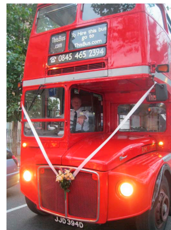
Londýnsky doubledecker a klasický anglický pub